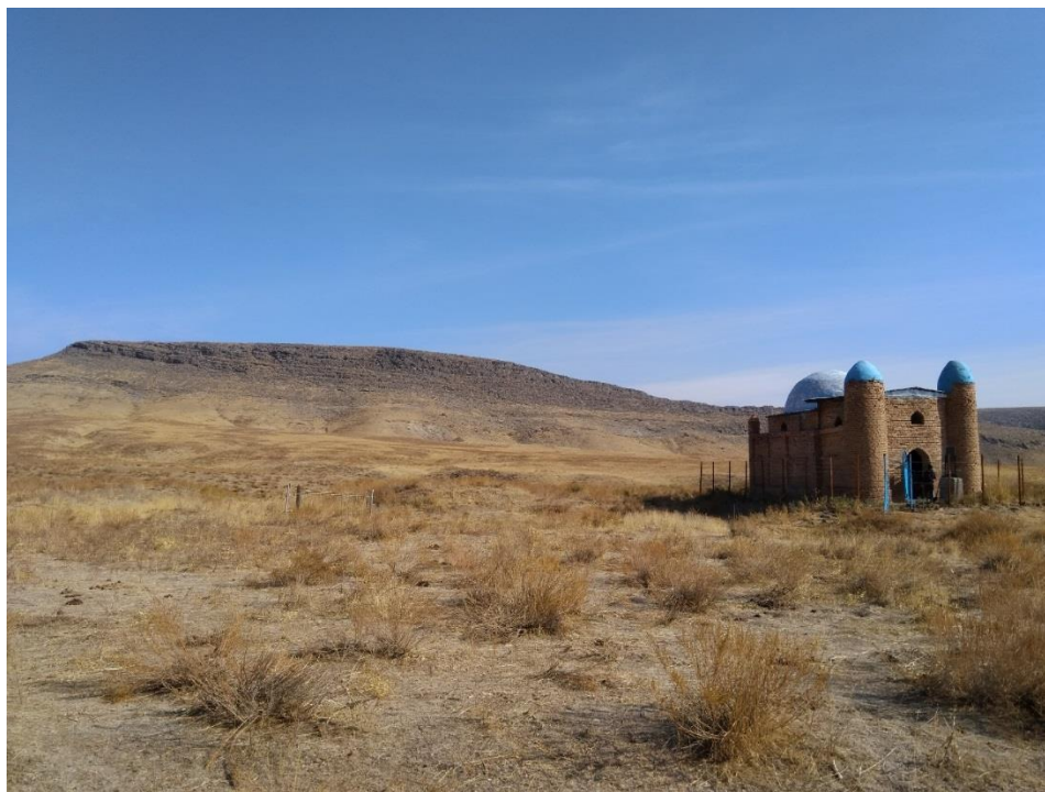
Рис. 1. Мавзолей Толена на фоне горы Огизтау.