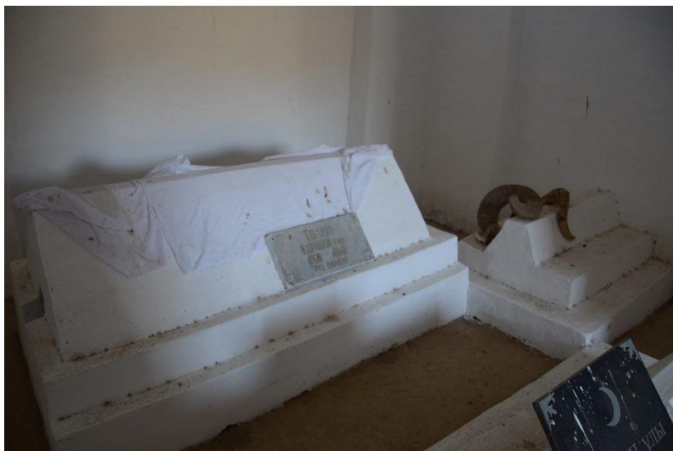
Рис. 5. Надгробия в усыпальнице мавзолея Толена.

Судя по использованию в качестве строительного материала кирпича царского времени памятник относится к концу XIX - начала XX в. Информация на каменной плите, установленной на портале мавзолея, отмечается, что она построена в 1893 г. На другой современной плите, установленной около памятника год возведения сооружения отнесен к 1892-1893 гг. Причем отмечено, что инициатором постройки был младший сын Толена Сыздық.